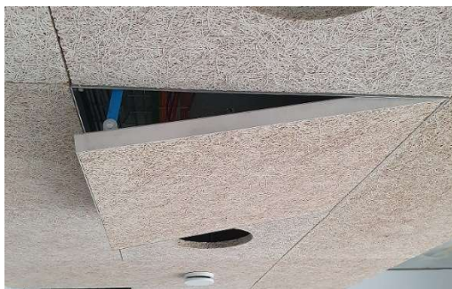
Image : Exemple d'installation dans un plafond en laine de bois