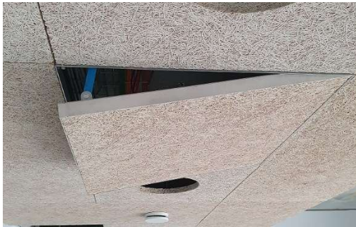
Bild: Einbaubeispiel in einer HWL-Decke